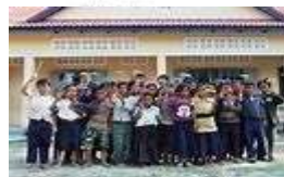
11枚の書きそんじハガキでひとりがひと月学校に。